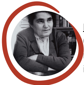
Evgenija Solomonovna Ginzburg

Coraggiosa oppositrice del regime staliniano, ha raccontato il suo viaggio nei Gulag.